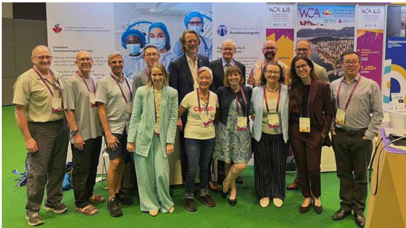
Délégués de la SCA et personnel du siège social au #WCA2024 à Singapour